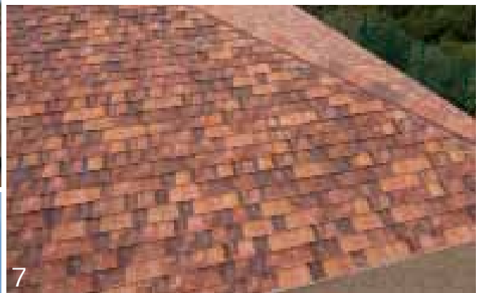
5. רעפי פלנום צבע חרס טבעי. 6. רעפי 'קופו' הניתנים ליישום בקלות ע"ג מרישים. 7. ויזום 3 צבע אולד אינגלנד, העבר והעתיד כבר כאן. 8. רעפי 'פורטוגז' צבע איטנה.