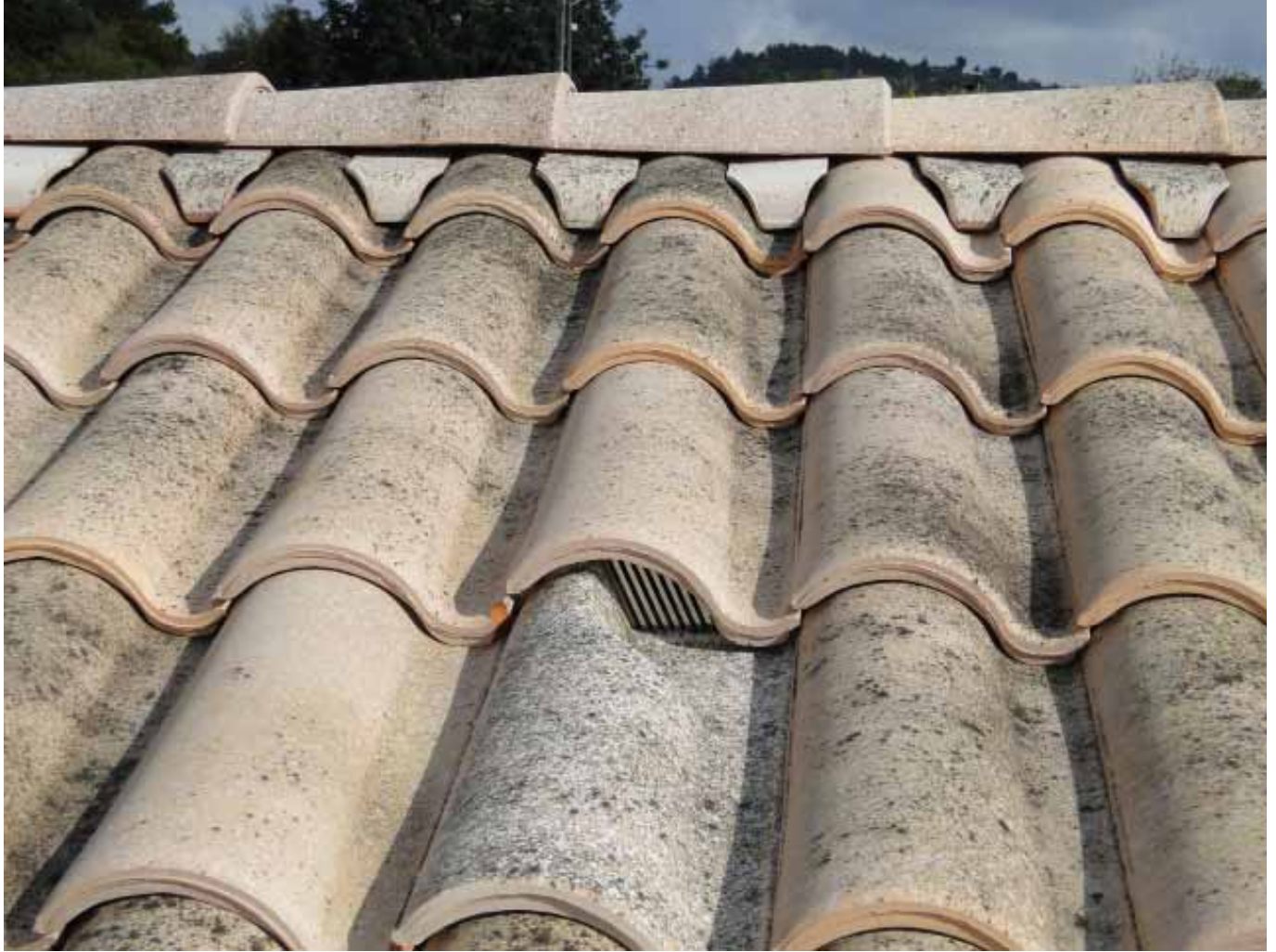
רעפים דגם 'פורטוגז' עם רכס מאוורר, ללא בטון.