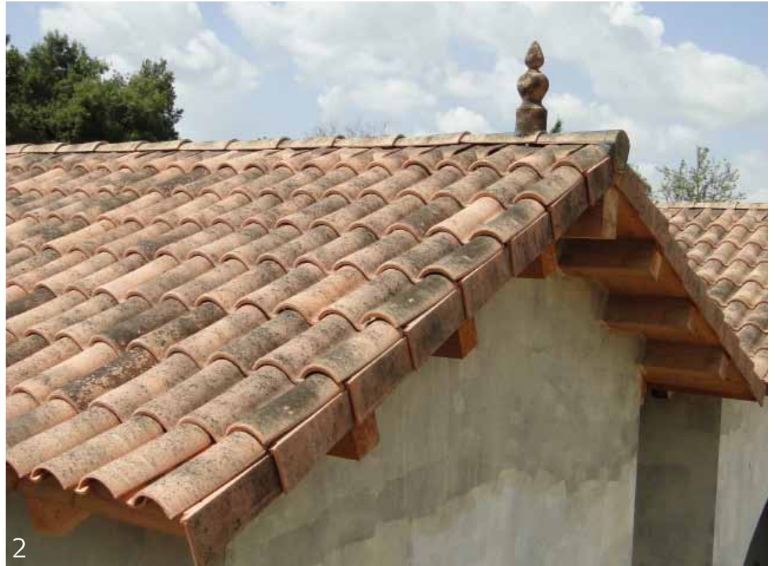
2. רעפי צד ואלמונט קישוט לרכס 'פירולי'. 3. נשם אוורור לצינור 4 צול עם כיפת חרס מעוצבת. 4. רוכבים עגולים למראה משופר של הרכס.

מכל החברות באירופה שאיתן עבדת בעבר החלטת לקבל נציגות בלעדית בארץ דווקא למוצרים של לה אסקנדלה. מדוע? "מעבר לכך שלה אסקנדלה מציעה מבחר עצום של דגמים וגוונים שלא קיימים בשום חברה אחרת, איכות הרעפים שלה היא הרבה מעל הנדרש על פי התקנים המחמירים ביותר באירופה ובארצות הברית, וכמובן בישראל. דוגמה קטנה להמחשה: בדרישה של מכון התקנים לעומס קריסה, החוזק צריך להיות לא פחות מ-180 ק"ג לרעף בודד. החוזק של רעפי לה אסקנדלה נע בסביבות 210 ק"ג לרעף בודד, ודגם הפורטוגז (דגם גליל חצוי עם שולי חפיפה) מגיע ל-640 ק"ג. הבדל משמעותי נוסף קשור לגוונים. היות וצביעת רעפי החרס נעשית לפני שריפתם, הנמשכת 20 שעות בחום של 900-1,050 מעלות, גוון הרעפים נשאר יציב עשרות שנים, זאת גם הסיבה שהחברה יכולה לתת 35 שנים של אחריות על שלמות הרעפים ועל הישמרות צורתם".